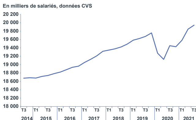
GRAPHIQUE 2 | Emploi salarié trimestriel

Champ : salariés du privé ; France (hors Mayotte).