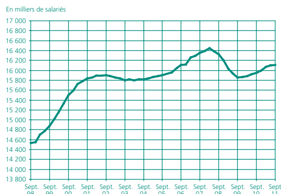
Graphique 2 • Emploi salarié trimestriel