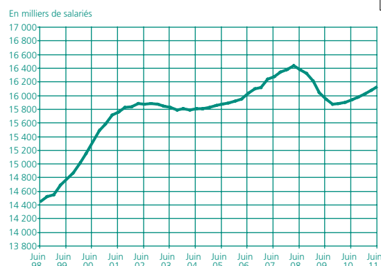
Graphique 2 • Emploi salarié trimestriel